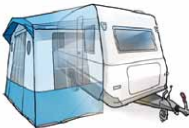
Exempel på campingenheter.